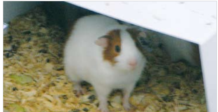
Junge Meerschweinchen in der Haltung der Verhaltensforschung. Die Tiere suchen Zuflucht unter einem einzigen Unterschlupf.