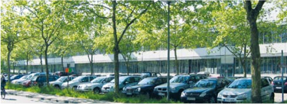
Das Gebäude der „Verhaltensforschung“ (VHF) oberhalb der Universität. Hier werden Versuche unterschiedlicher Art durchgeführt, neben Verhaltens- experimenten zum Beispiel auch toxikologische Forschung.

Grundordnung widerspricht. Den Bürger_innen werden essentielle Informationen über Tierversuche konsequent vorenthalten, obwohl sie als Steuerzahler_innen regelmäßig in Milliardenhöhe dafür zur Kasse gebeten werden. Die Propaganda für Tierversuche wird mit Bürgergeld finanziert. Tierversuchgegner_innen hingegen sind auf freiwillige Spenden angewiesen. Propaganda für Tierversuche schürt geschickt die Angst vor Krankheit und Tod, denn verängstigte Menschen stellen keine Fragen.