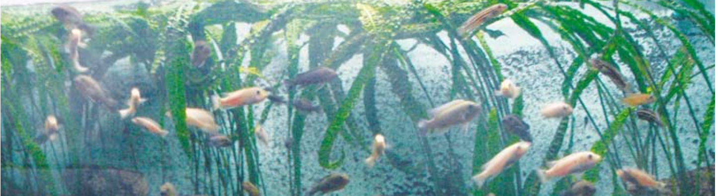
Zu Ausbildungszwecken: Eines der Aquarien der Biologie.

in den folgenden Arbeitsbereichen Experimente an Tieren durchgeführt werden: